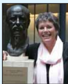
UNHCR / G. T. TINDE • 2008

Если вы заинтересованы в том, чтобы узнать больше о том, как вы или ваша организация можете участвовать в инициативе WLL, вы окажете нам честь беседой с нами.